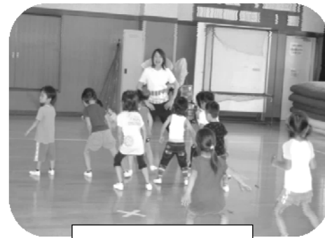
キッズダンス教室